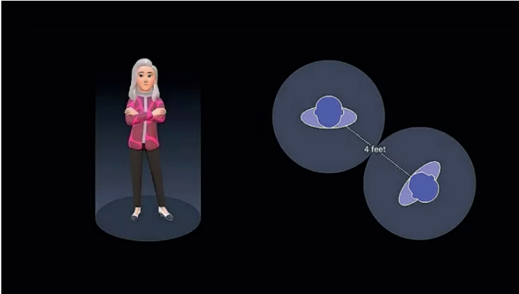
Meta usa recurso de limites pessoais no metaverso por casos de assédio