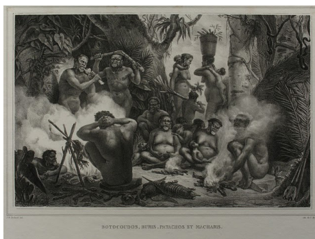
Figura 2. Índios Botocudos (Aimorés), Puris, Pataxós e Machacalis. Debret, Viagem pitoresca e histórica ao Brasil , 1834.